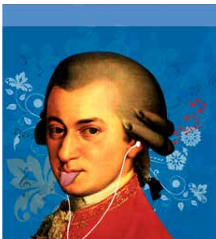
Auteur: affiche classisco