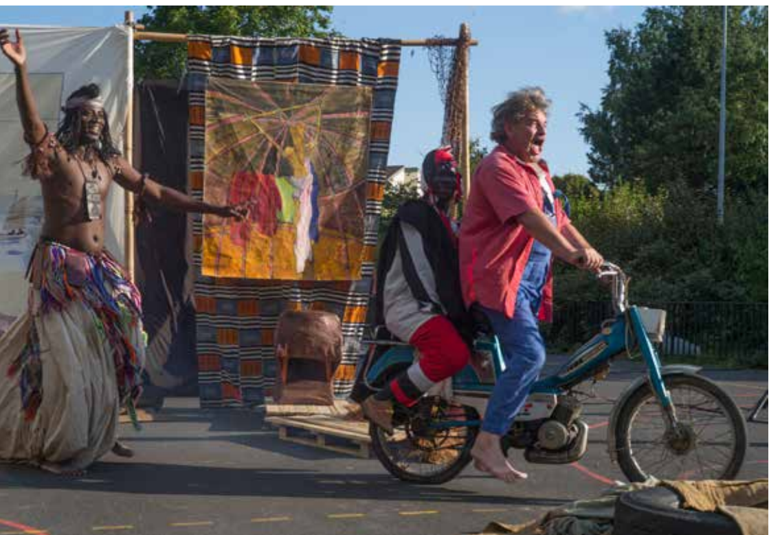
« Les tréteaux du Niger » Auteur : Jean-Pierre Estournet